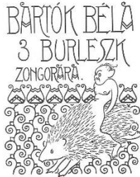
Drie Burlesken. Titelpagina van de eerste uitgave

Zoals wel vaker in zijn sonates kiest Beethoven voor het slotdeel de vorm van een Rondo. Na een vurig muzikaal betoog keert tegen het eind van dit deel met een meesterzet plots de toonsoort As majeur terug en breekt even de zon door, waarna de muziek met grote intensiteit eindigt in de oorspronkelijke toonsoort.