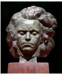
Beethoven, door beeldend kunstenaar Georges Gori

Al bij de eerste druk van Beethoven's achtste pianosonate vermeldde het titelblad Grande Sonate Pathétique . Waar titels in veel gevallen door de uitgever bedacht werden, of in de loop van de uitvoeringspraktijk ontstonden, is het aannemelijk dat de titel in dit geval van Beethoven zelf afkomstig is, of op zijn minst dat hij ermee instemde. Met Grande Sonate maakt de componist zijn