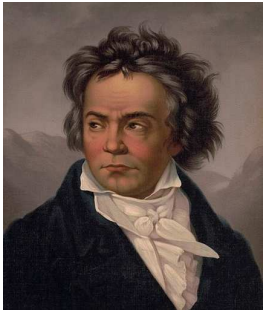
Beethoven 1819 Joseph Karl Stieler

stukken ter vervanging van de klassieke structuren, die hem hinderden. Hij bestudeerde Bach, Händel en Palestrina en beoefende ook zelf de polyfonie in deze periode. Het is de periode van intense verdieping, van de Missa Solemnis , de Diabelli variaties en de 9e symfonie . En van het experiment, van de ontzag inboezemende laatste werken, die in alles afweken van wat ooit geschreven was. Delen gaan in elkaar overlopen, worden samengevoegd.