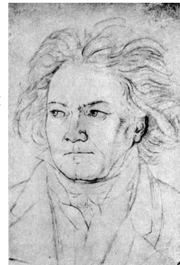
Beethoven in 1818, August Klöber

Strijkkwartet opus 135 uit oktober 1826 is het laatste grote werk dat Beethoven schreef, kort voor zijn dood in maart 1827. Het kwartet lijkt het zwarte schaap tussen de laatste 6 kwartetten: minder groots van opzet, minder gecompliceerd, alsof de componist plotseling de nieuwe simpele waarheid gevonden heeft na veel strubbelingen. Het laatste deel kreeg de titel Der schwer gefasste Entschluss (De moeilijke beslissing) mee, waarin hij bovendien in de inleiding schreef Muss es sein? , waarop hij antwoordt met het snellere hoofdthema van dit deel, Es muss sein! De oplossing van deze mysterieuze woorden ligt in het briefje van Beethoven aan zijn uitgever: Hier, mijn vriend, mijn laatste kwartet!