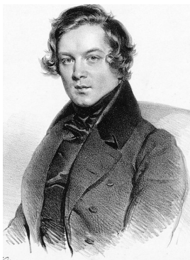
Schumann in 1839

Bartók schreef het werk met in gedachten een Keizerlijke Bösendorfer, die meer bastonen heeft. Maar dat zal een willekeurige geïnteresseerde concertbezoeker die het moet doen met de aanwezige Steinway, niet opvallen. In feite gaat het hier om Bartók's 2 e pianosonate, want hij had er in zijn vroege jeugd in 1896 ook al een geschreven, in laat-romantische stijl. Hij was toen 15. Dat stuk geniet weinig bekendheid.