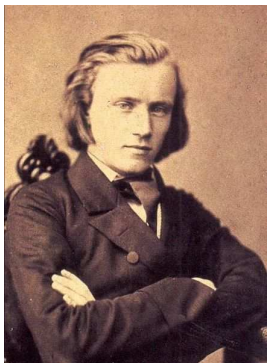
Joh. Brahms in 1853

Dat kan kloppen. Brahms heeft zich in de 1 e ballade laten inspireren door het huiveringwekkende Schotse gedicht Edward (uit Herder, Stimmen der Völker ), een lievelingsboek van Brahms. De bange vragen van de moeder, de ontwijkende antwoorden van haar zoon, de tekst laat zich zo in het metrum van de