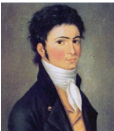
Een der vroegste portretten van Beethoven (ca. 1800)

Graaf Von Waldstein schreef aan Beethoven, die in 1792 zijn tweede reis naar Wenen maakte: 'Door grote ijver zul je Mozart's geest bezitten uit de handen van Haydn.'