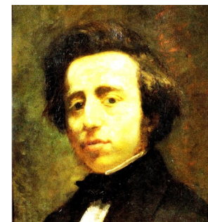
Frédéric Chopin, Schilderij Thomas Couture (1815-1879)