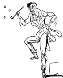
Der Kapellmeister Kreisler im Wahnsinn (tekening E.T.A. Hoffmann)

De Duitse jurist, maar vooral schrijver, schilder en componist Ernst Theodor Wilhelm Hoffmann (1776-1822) veranderde zijn derde voornaam in Amadeus uit bewondering voor Mozart. Hij geldt als de grondlegger van het 'genre fantastique', waarvan in Engeland Edgar Allan Poe en in Nederland Belcampo navolgers waren. In 1815 verschijnen van hem twee reeksen opstellen over muziek, 'Kreisleriana', genoemd naar de fictieve auteur ervan, de kapelmeester Johannes Kreisler. In 1821 verschijnt als onderdeel van 'Lebensansichten des Katers Murr' een fragmentarische 'biografie' van deze Kreisler, die de personificatie is van de aan zijn kunst lijdende artiest, onbegrepen door de onartistieke burgerlijke 'filisters'. Met dit rusteloze, vol onzekerheid en innerlijke tegenstellingen verlopende leven zal Schumann zeker veel verwantschap hebben gevoeld.